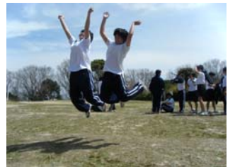
こうやってジャンプアップ!!

学習の合間には甲山山頂へのハイキングや校歌の練習もおこない、充実した3日間を過ごしました。朝一番早い生徒は4時から「朝学」にとりくみ、5時過ぎには、クラスの半分以上が「朝練」を始めました。 勉強も部活も 。合宿先でも実行しています。