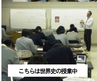
こちらは世界史の授業中

3年後の自分をめざして進路講演を聞き、その後は5教科の授業・自習。合宿中の授業は基本は80分です。