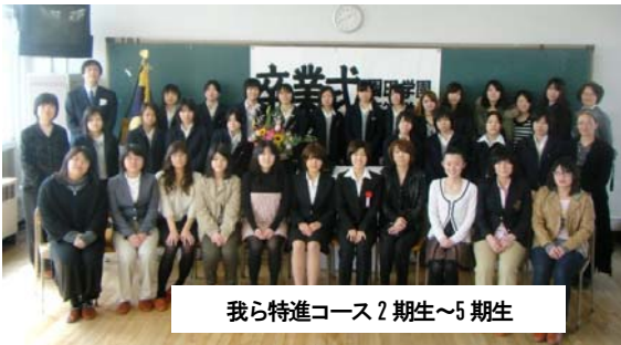
我ら特進コース2期生～5期生

4期生・5期生の在校生に加えて大学生である2期生もたくさん参加して、4学年が一堂に会し、3期生ひとりひとりの体験談に耳を傾けました。