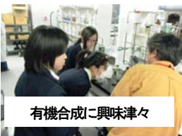
有機合成に興味津々

4月20日は、2年3年で「 関西8大学 」のひとつである甲南大学の見学に出かけました。