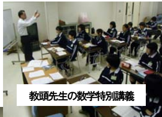
教頭先生の数学特別講義